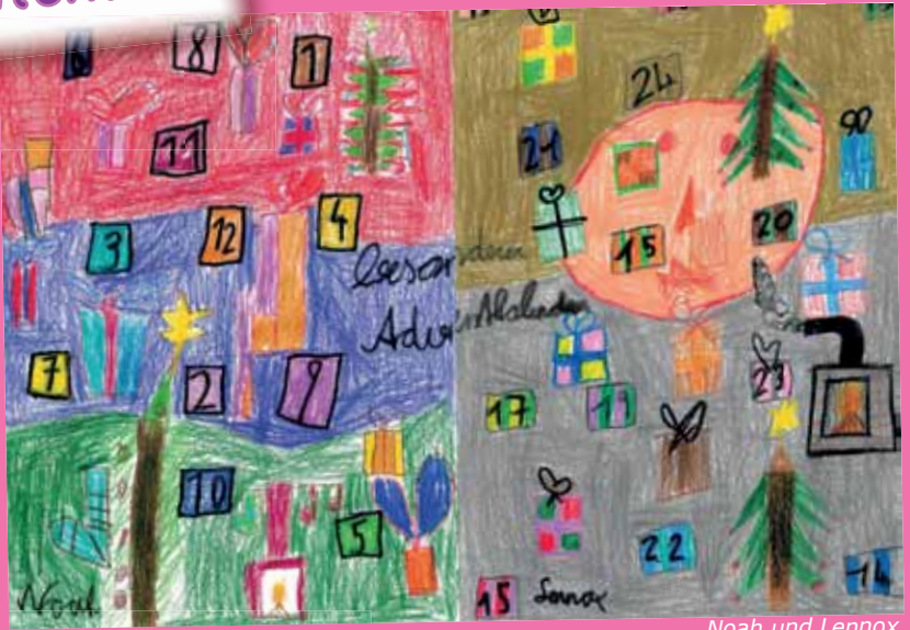
Noah und Lennox