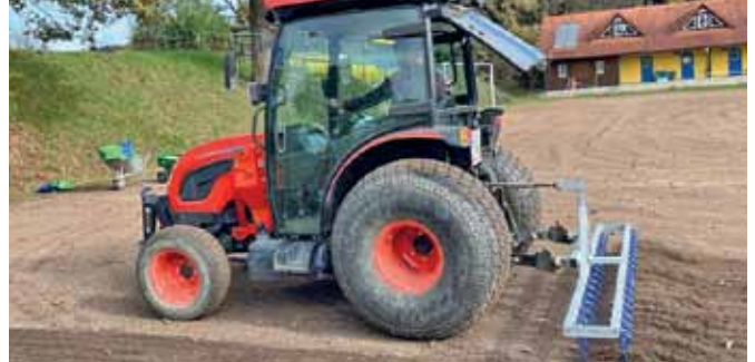
Vollster Einsatz bei der Sanierung des Sportplatzes in St. Josef.

Nach der Winterpause geht es dann Ende Jänner/Anfang Februar 2024 wieder los. Ein großes Danke der Gemeinde St. Josef (Weststeiermark) und dem Land Steiermark für die Sanierung der Spielflächen nach dem Hochwasser im August. Hoffentlich sind die Regenfälle in Zukunft nicht immer so stark, sodass sie weitere Schäden anrichten. Im Frühjahr wartet zudem eine Menge Arbeit, da auch die Schutzzäune und die Betreuerhäuschen neu errichtet werden müssen.